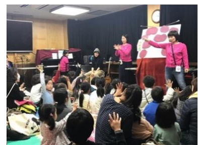
Xマスフォーキッズあそび隊 (右下)